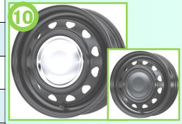
⑩ ネオキャロ (スチールホイール) 軽カーの12と14インチのみ設定有り ※純正ナット使用

※表に記載されていない車種、サイズ、その他タイヤメーカー、オールシーズンタイヤ、ご希望の場合はお問い合わせください。 ※為替が不安定な為、期間内でも急激な値上げをお願いする場合がございます、御了承下さい。