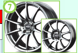
⑦ MID スタック メタリックグレー ※12インチ設定無