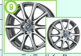
⑨ ティラードイータ ハイライトシルバー