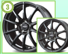
③ MID スタック ストロングガンメタ ※12インチ設定無