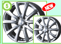
⑤ ジョーカースマッシュ シルバー