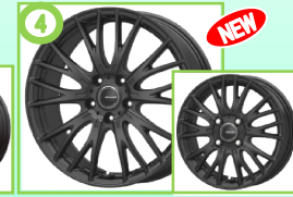
④ クレイシズ SE48 マットブラック