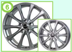
⑥ エクシーダーE07 ダークシルバー