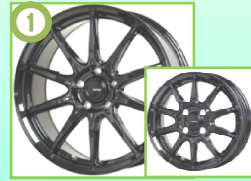
① G-スピード GO5 メタリックブラック