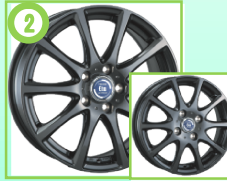
② ティラードイータ グラファイトグレー