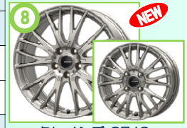
⑧ クレイシズ SE48 ブライトシルバー